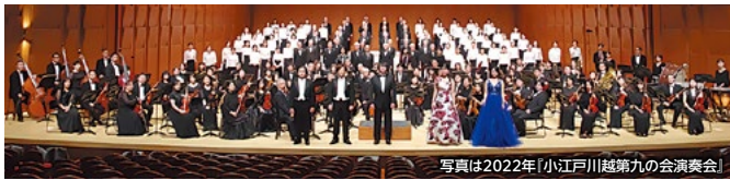
写真は2022年「小江戸川越第九の会演奏会」