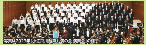
写真は2023年「小江戸川越第九の会 演奏会」の様子