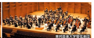
東邦音楽大学管弦楽団