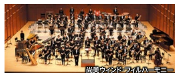
尚美ウインド・フィルハーモニー