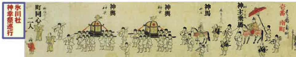
「川越氷川祭礼絵巻」 文政9年(1826) 伝 江野樺雪画 (県指定・有形民俗文化財)

江戸時代の川越氷川祭礼に感じる多文化共生の源流を一層発展させる川越市民の文化行事としての出発です。皆さんと共に他国の文化を尊重し合い、対等な関係を築く基盤は、自国や郷土の文化を理解し尊重し合うことではないかと考えます。本日の各団体、グループの演し物や出店から相互の文化的特色を感じ入って頂ければ幸いです。