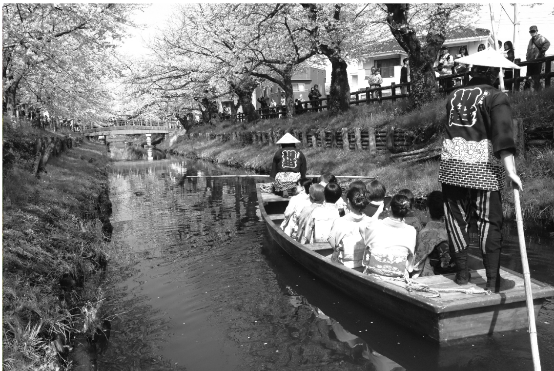
▶小江戸川越 春の舟遊「きもの舟」の様子