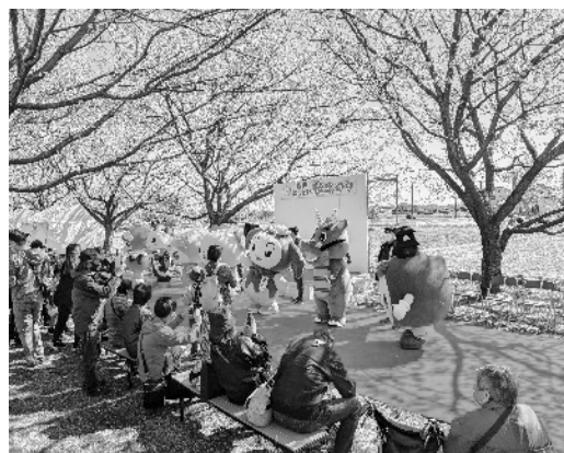
坂戸につさい桜まつり