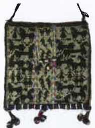
馬・人物・動物文様紋織提袋(部分) / ボリビア・チュキサクカ / 20世紀