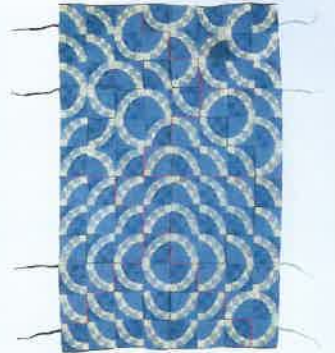
「1/4円繋ぎ文様緯絹頭衣」 小林桂子作/1980年