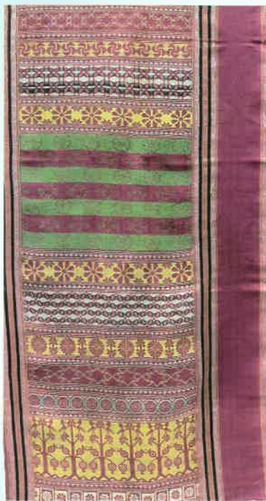
花鳥文様緯錦飾り布(部分)/チュニジア/19世紀