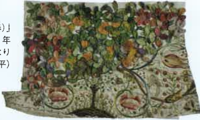
「プランタン(春)」 小林桂子作/2021年