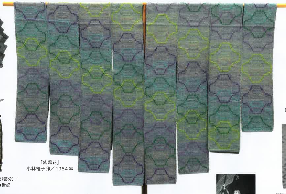
「紫陽花」 小林桂子作 / 1984年