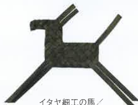
イタヤ細工の馬 / 日本・秋田県 / 1990年代