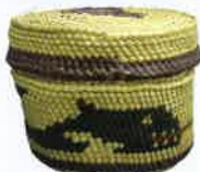
オルカ漁図入り蓋付小物入れ / カナダ・ソルトスプリング島 / ヌートカ族 / 1980年代