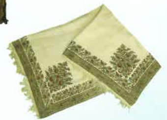
花束文様綾地補緯糸紋織肩掛/ フランス/19世紀初め