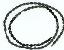
人毛の組紐ネックレス/ スイス/20世紀前半