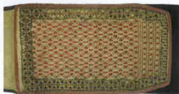
儀式用帯(部分) / インドネシア・スマトラ島 / 1960年代