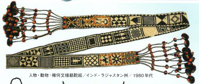
人物・動物・幾何文様駱駝紐/インド・ラジャスタン州/1980年代