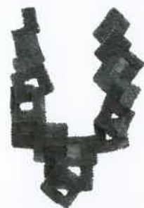
「角輪つなぎ」 小林桂子作 / 1986年