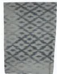
緯緋裂 / フランス / 18世紀頃