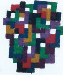
「地図Ⅳ」 小林桂子作/1986年