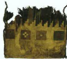
幾何・経緯文様織合わせ織・ 縫取り織コカ袋(部分)/ ペルー・チャンカイ文化 (1100-1470年頃)