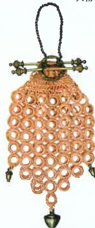
鉤針編の財布/ ヨーロッパ/19世紀頃