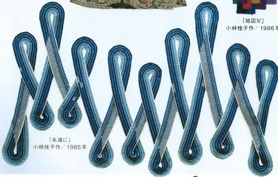
「永遠に」 小林桂子作/1985年