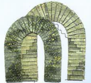
ゲートシリーズより「中国ドラゴンの門」 小林桂子作/1998年