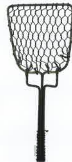
網豆腐掬い / 日本・京都府 / 1975年