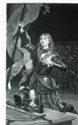
絵画織「ジャンヌ・ダルク」 / フランス・サン・ティエンヌ ネイレ・フレール社 / 20世紀初め