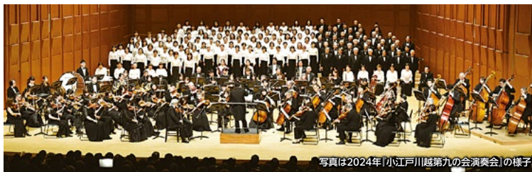
写真は2024年「小江戸川越第九の会演奏会」の様子