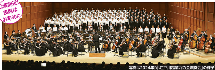
写真は2024年「小江戸川越第九の会演奏会」の様子