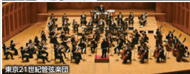
東京21世紀管弦楽団

オペラ『蝶々夫人』(G.プッチーニ作曲/全2幕/セミ・ステージ形式/日本語字幕付き)