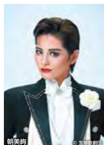
朝美絢 ※写真は公演のものとは異なります

※チケット発売日表記中の“会員”とはウェスタ川越webメンバーズ会員のことで、ウェスタ川越webメンバーズ会員の方は「ウェスタ川越オンラインチケットサービス」をご利用ください。 [提案事業]