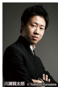
川瀬賢太郎

【曲目】ベルリオーズ:「ローマの謝肉祭」序曲、ピアノ:バンドネオン協奏曲「アコンカグア」、ブラームス:交響曲第1番