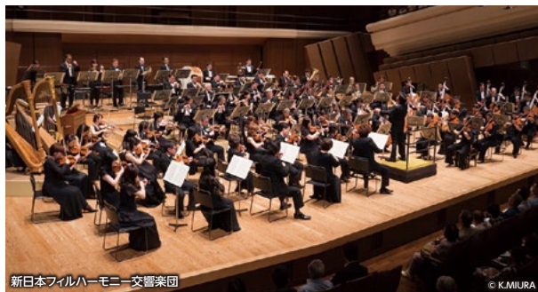
新日本フィルハーモニー交響楽団