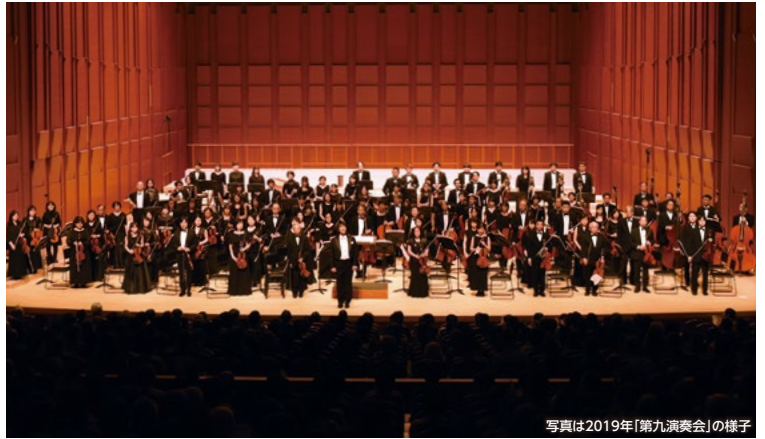
写真は2019年「第九演奏会」の様子