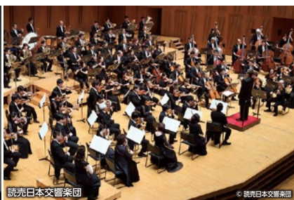
読売日本交響楽団