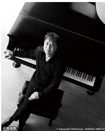
小曽根真